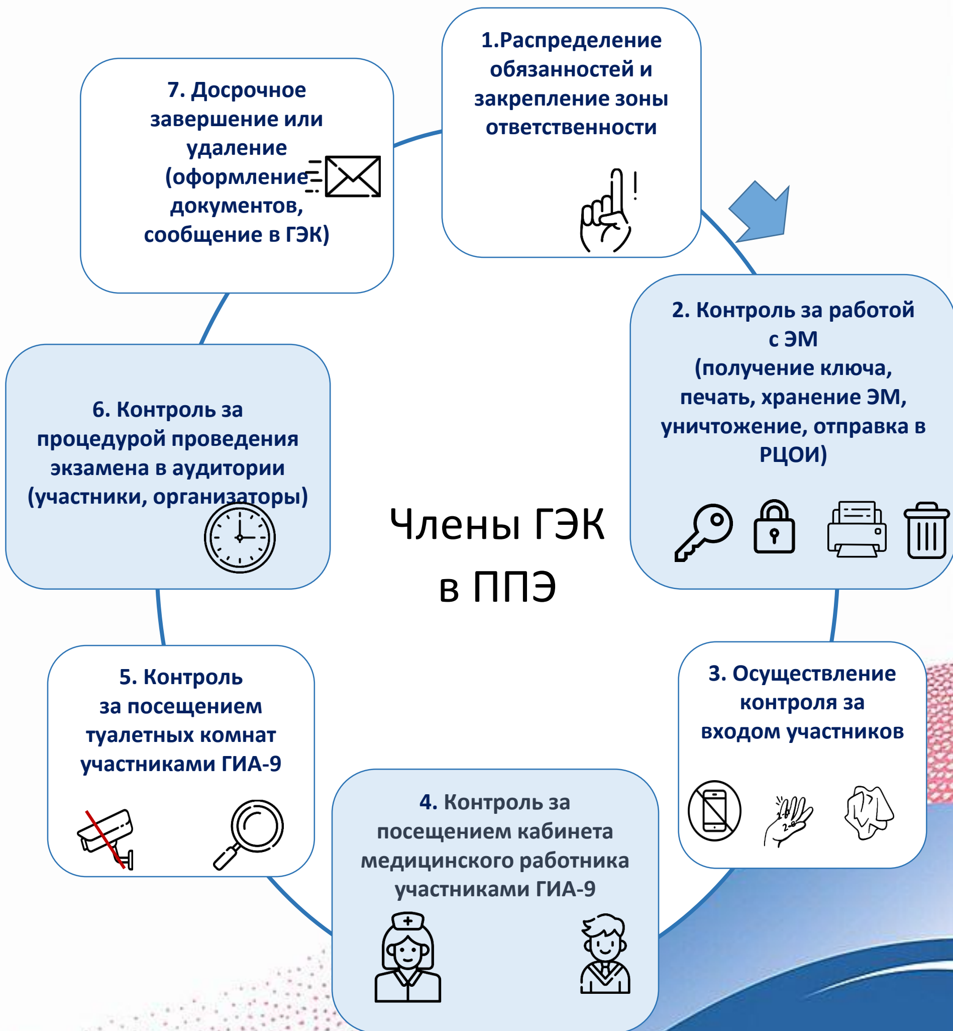
СХЕМА РАБОТЫ ЧЛЕНОВ ГЭК